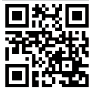
QR-Code oben Android, QR-Code unten iPhone