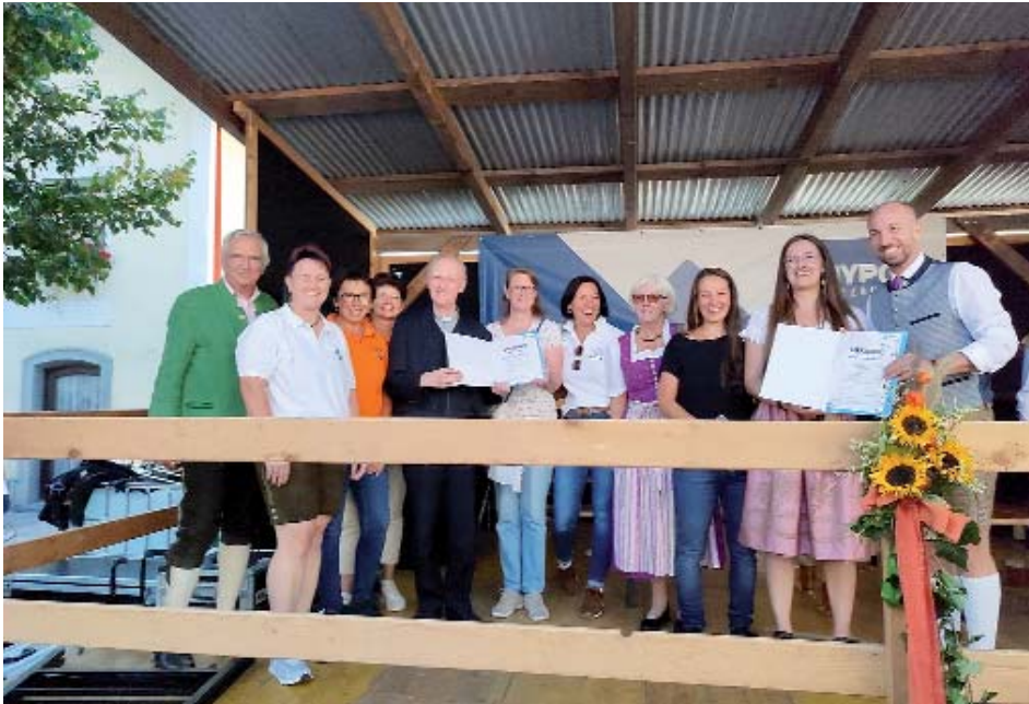
Die Teams von Gemeinde- und Pfarre-Neumarkt am Wallersee bei der Preisverleihung