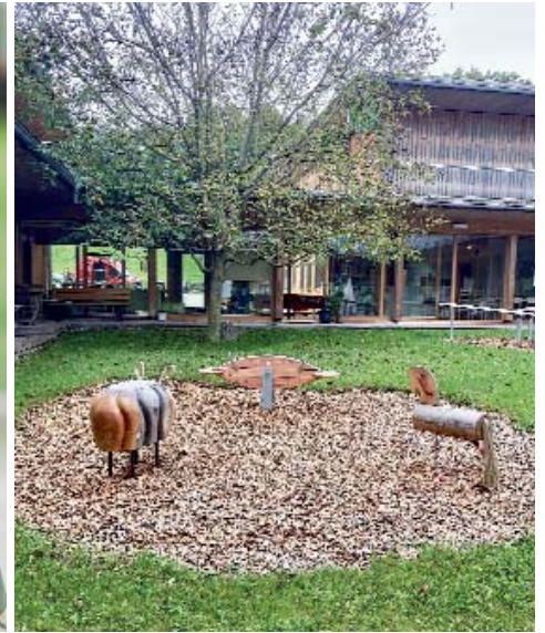
Außenanlage Sonneninsel