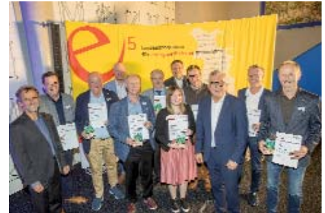
Die Bürgermeister der Preisträger Gemeinden „Photovoltaik im Gemeindegebiet“, darunter fünf aus dem Salzburger Seenland, nicht am Bild Gemeinde Straßwalchen.

■ Weitere Informationen gibt es beim Klimabündnis Salzburg unter https://www.klimabuendnis.at/angebote/don-camillo-und-peppone/ bzw. per Mail an salzburg@klimabuendnis.at