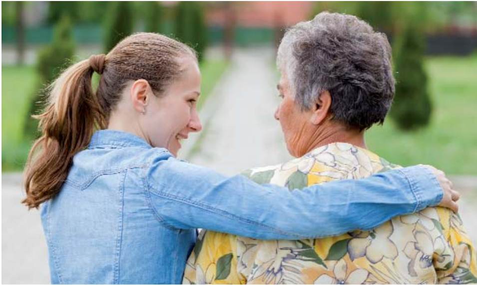
Generationsübergreifende Projekte