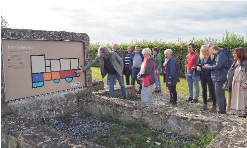
Ausgrabung Bad Altheim