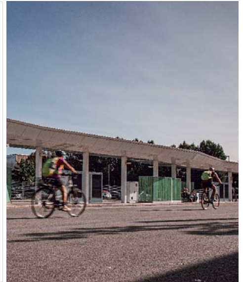
LEADER Förderaufruf