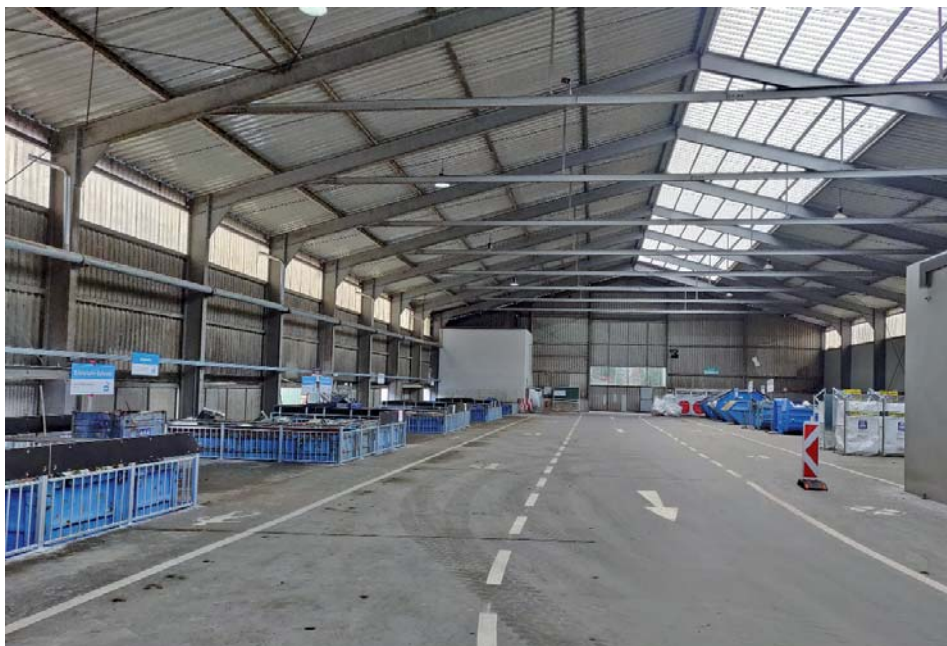
Altstoffsammelhof Seekirchen, Foto: RVSS